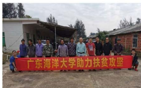
图 7.2 人民日报海外网、南方+广东教育头条报道媒体宣传

4月中旬，雷州市覃斗镇后洪村、英楠村的17户贫困户收到了来自广东海洋大学珍珠研究团队赠送的1亿粒珍珠贝苗，在新冠肺炎疫情之后重燃脱贫致富的希望。