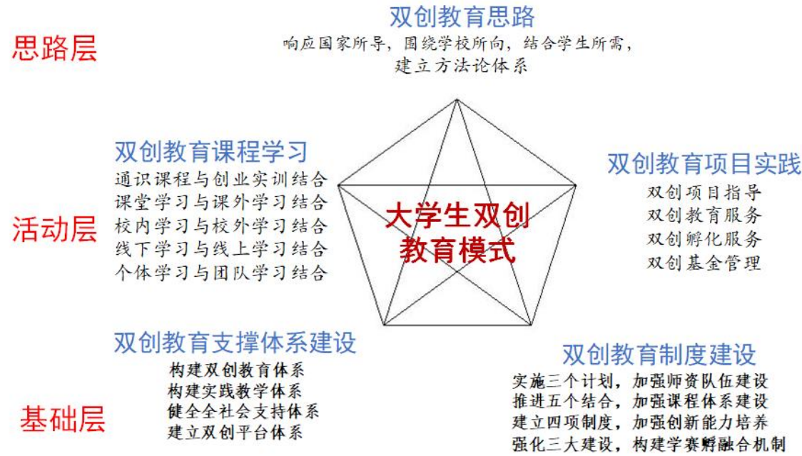
图 7.1 大学生创新创业三层五维教育模式

响应“国家所导”，围绕“学校所向”，结合“学生所需”，构建四位一体、协同育人，突出涉海学科产业特色的创新创业教育模式。以科学的系统方法论为指导，构建了大学生创新创业教育三层五维理论框架和路线图（图 7.1）。